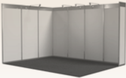
System 1: Octanorm 43 € je m 2