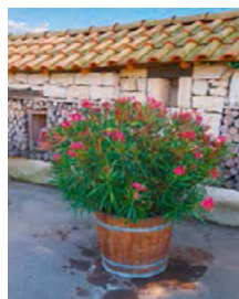
Pflanzen der Preisgruppe 3 (Abbildungen exemplarisch)

*Der Versicherungsbeitrag ergibt sich aus „Anzahl geliehener Pflanzen“ multipliziert mit „Tarif der jeweiligen Preisgruppe“