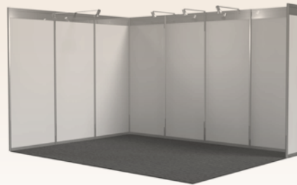
System 2: Octanorm € 51 je m 2