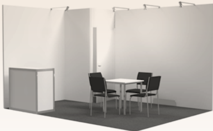
System 3: Holz tapeziert inkl. Ausstattung: 1 Tisch, 4 Stühle, Infotheke, abschließbare Kabine (1 x 1 m) € 62 je m 2